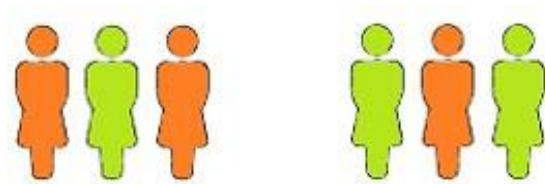
Klassen der Rundenwettkämpfe

Damit verhindern wir gemeinsames Fahren und, wenn Ersatzschützen mit beteiligt sind, auch eine Vielzahl von Personen vor Ort.